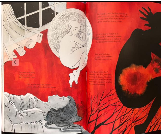
Figure 1 Subjectivity of Offred and the artist

For this figure, it is important to point out that Atwood has been using circles in her literary works for a long time (Ng 2019). Myhal (1995) further elaborates that the circle in Atwood's text is never connected entirely with security but a much ambivalent and, at times, threatening connotation that shapes, limits, and suppresses. In this novel, circles do indeed carry such a mixed connotation for the handmaid Offred, as they provide June some sort of protection in Gileadean society while at the same time threatening her mental and physical safety with suppression and threats. In this story, circles frequently appear – in Waterford's house, the Red Centre, and Jezebels, all places where June's rights are taken away – so the circles in these settings are like a prison to trap Offred and strip away her freedom. In other words, when circles are shown to the audience, the protagonist experiences violence and pain. In contrast, circles also carry a nostalgic appeal for her, often reminding her of pre-Gilead memories. Therefore, the representation of the circles in the graphic narrative could be a great challenge for the graphic artist.